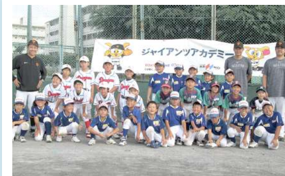
▲レベルアップ講習会参加の少年野球チーム

また、当日どなたでも参加可能なストラックアウト&ティーバッティング体験では、保護者が子どもにバットの持ち方、打ち方を教えながら見本を見せたりして、多くの親子触れ合いの場面が見られました。中には、子どもよりも保護者が体験イベントに夢中になっている姿も見られ、スポーツカーニバル全体で親子交流、地域交流が盛んに行われていました。